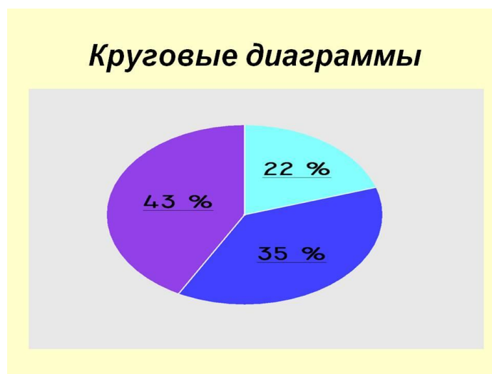
Рисунок 1 – круговые диаграммы